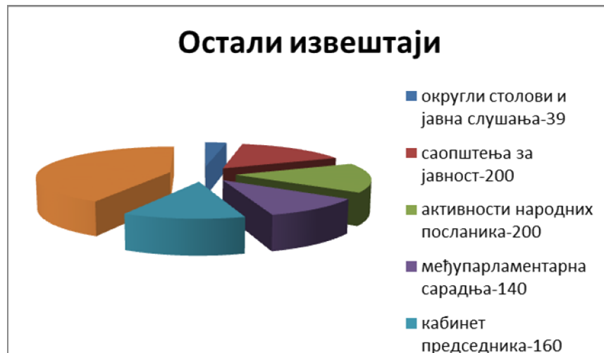
Слика 3 – број текстова са осталих догађаја

Одељење је пропратило и све одржане округле столове и јавна слушања, са којих се израђено 39 извештаја . Урађено је 200 саопштења за јавност, пропраћено је 200 различитих догађаја на којима су учествовали народни посланици, а израђено је и 140 извештаја о међупарламентарној активности Народне скупштине. За потребе Кабинета председника Народне скупштине, Одељење је израдило 160 текстова .